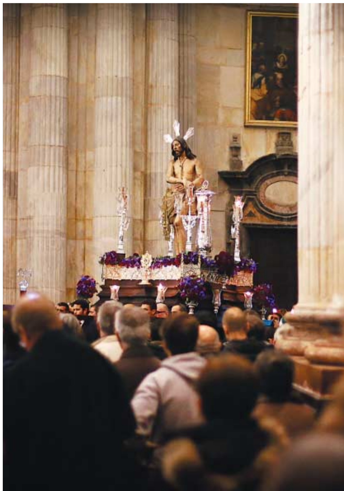
El Señor de Columna, en el interior de la Catedral.