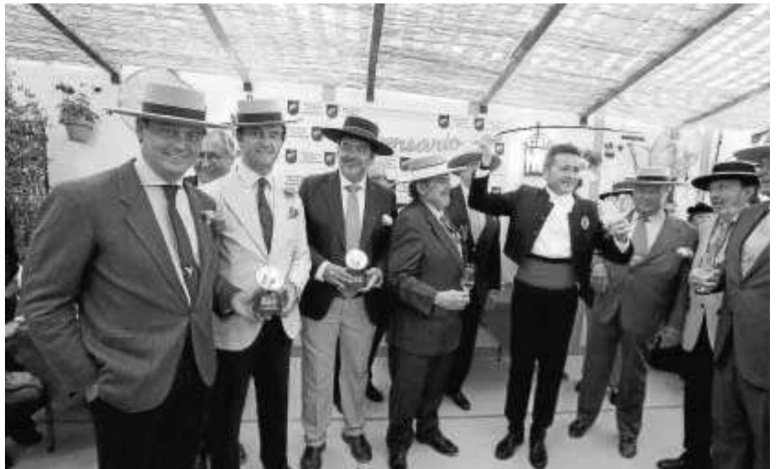
Los premiados y los organizadores se disponen a brindar tras la entrega de los premios.

Tras la entrega de los premios se celebró en la caseta un acto de convivencia en el que participaron los miembros de la Asociación Sombrero de Ala Ancha Jerezano, los premiados y los muchos invitados que acudieron a la cita.